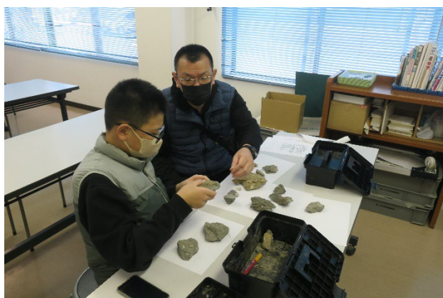
写真2. 自分で採集した化石の同定中。